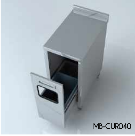
Çöp Ünitesi (Raylı) Trash Unit (Rail)