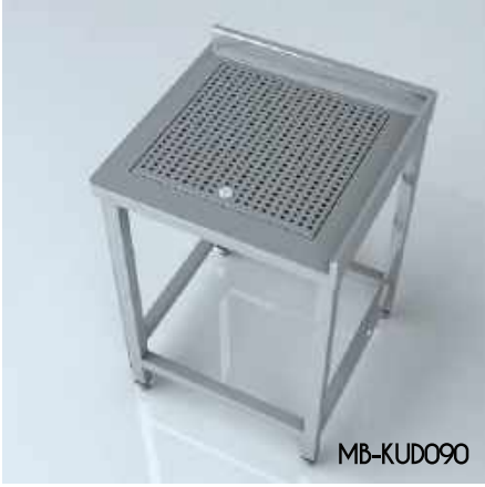
Köşe Ünitesi Damlalık Corner Unit Dropper