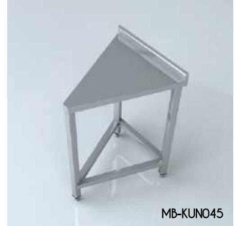
Köşe Ünitesi Notr Corner Unit Notr