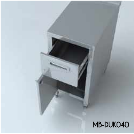
Dolap Ünitesi (Kapılı) Cabinet Unit (with door)