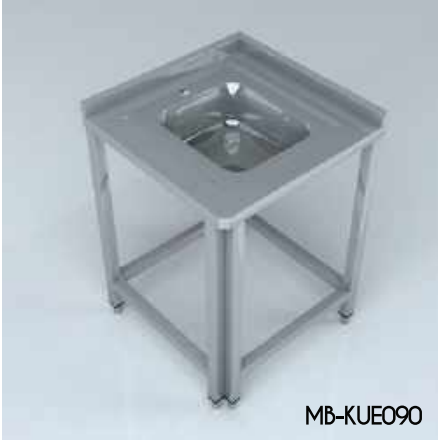
Köşe Ünitesi Eviyeli Corner Unit With Sink