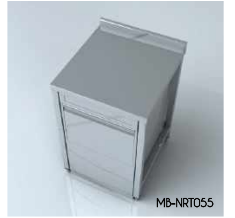
Notr Tezgah (Bulaşık Makinesi) Notr Bench (Dishwasher)