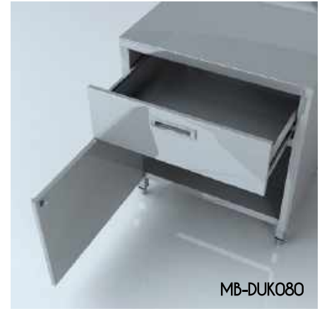
Dolap Ünitesi (Kapılı) Cabinet Unit (with door)