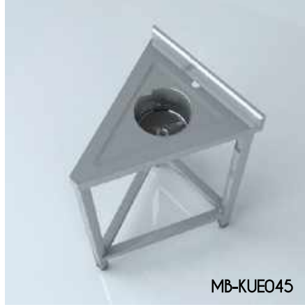
Köşe Ünitesi Eviyeli Corner Unit With Sink