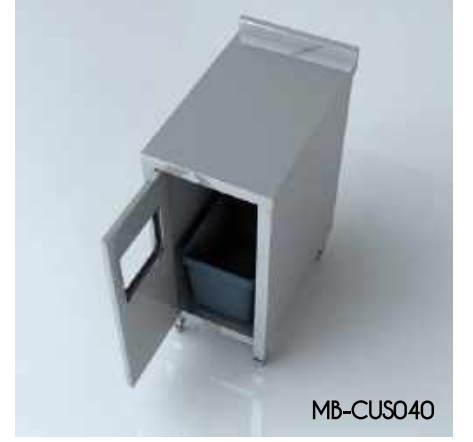
Çöp Ünitesi (Standart) Garbage Unit (Standard)