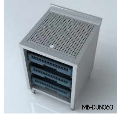
Damlalık Ünitesi Dropper Unit