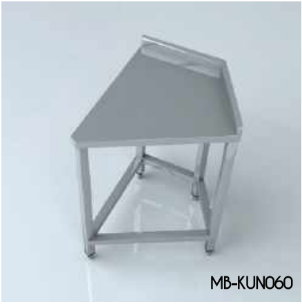
Köşe Ünitesi Notr Corner Unit Notr