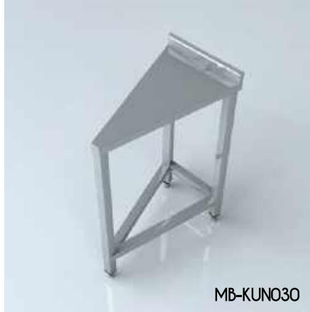
Köşe Ünitesi Notr Corner Unit Notr