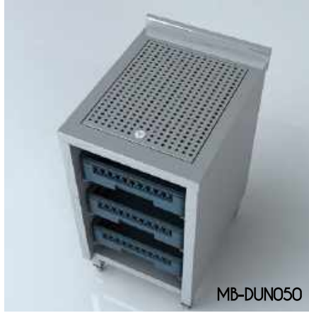
Damlalık Ünitesi Dropper Unit