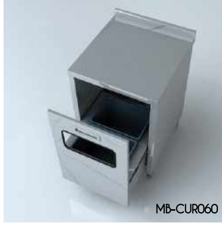
Çöp Ünitesi (Raylı) Trash Unit (Rail)