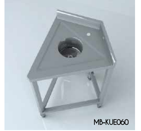
Köşe Ünitesi Eviyeli Corner Unit With Sink