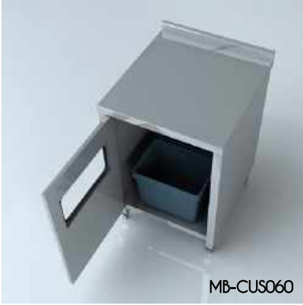
Çöp Ünitesi (Standart) Garbage Unit (Standard)