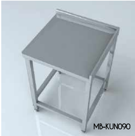
Köşe Ünitesi Notr Corner Unit Notr